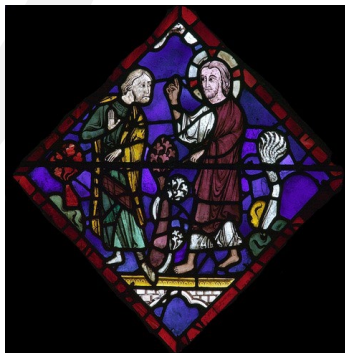
© Noah-Fenster in der Kathedrale von Chartres mit freundlicher Genehmigung der Diözese Chartres